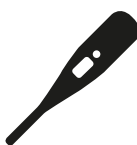
Verhoging of koorts