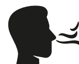
Reuk- en/of smaak- verlies

Heb je op dit moment een huisgenoot met koorts en/of benauwdheidsklachten?